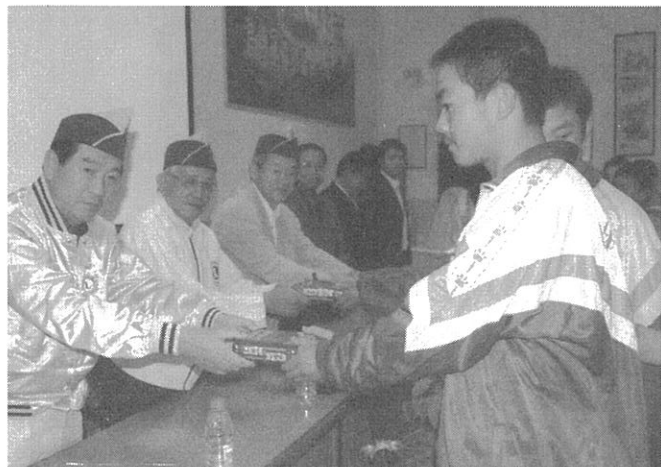
西吉和平中学校にて辞典寄贈

中国の社会資本整備の実態と現地での貧困の子どもたちの姿を見ると、援助の意義について、気持ちが交錯する。