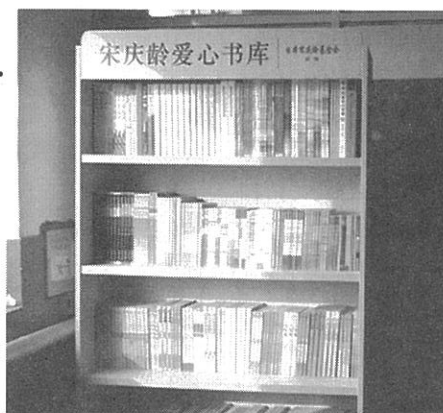
易県独楽郷中心小学校に寄贈の図書