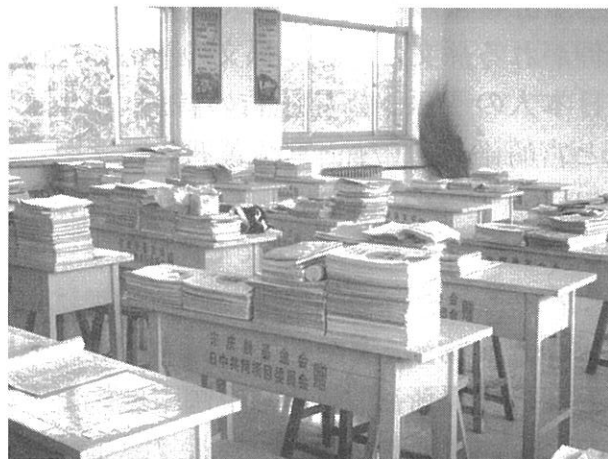
西陵中学校の机と椅子