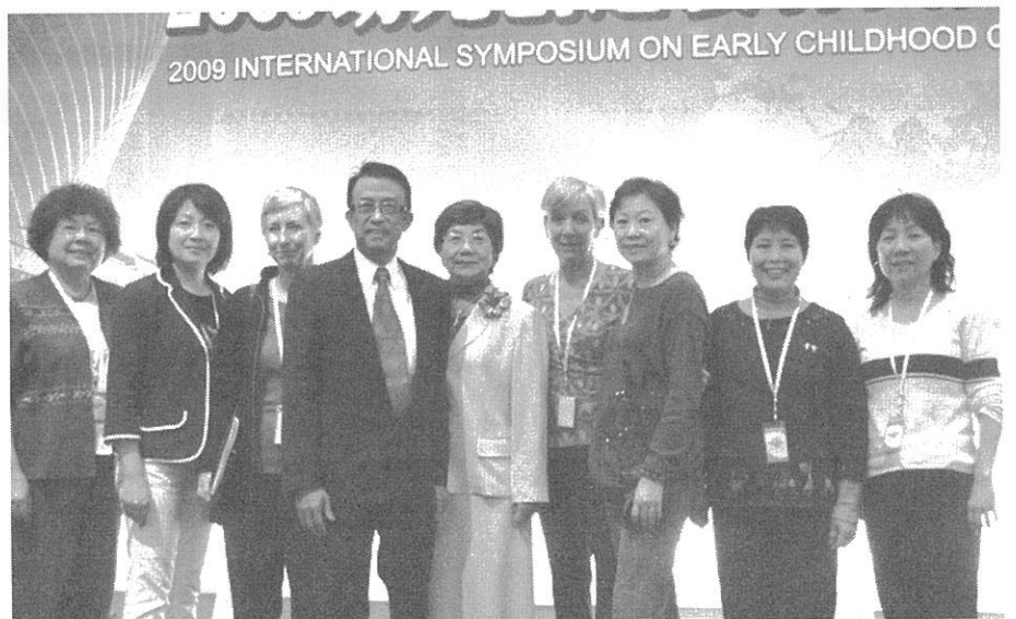
カナダ宋慶齡兒童基金会の皆さんと

期間中には、中国福利会幼稚園60周年記念式典と中国福利会幼稚園見学もあり、旧交を温めつつ、新たな交流の場を得ることができました。